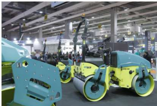
Asphaltica 2017.